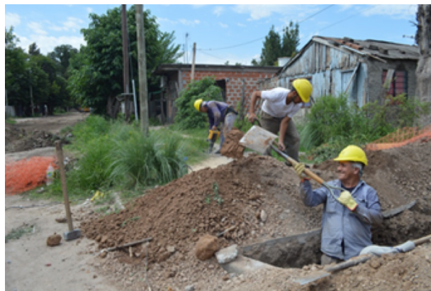
Tendido de redes.

Meta de Prioridad Nacional. Informe Voluntario Nacional 2017.